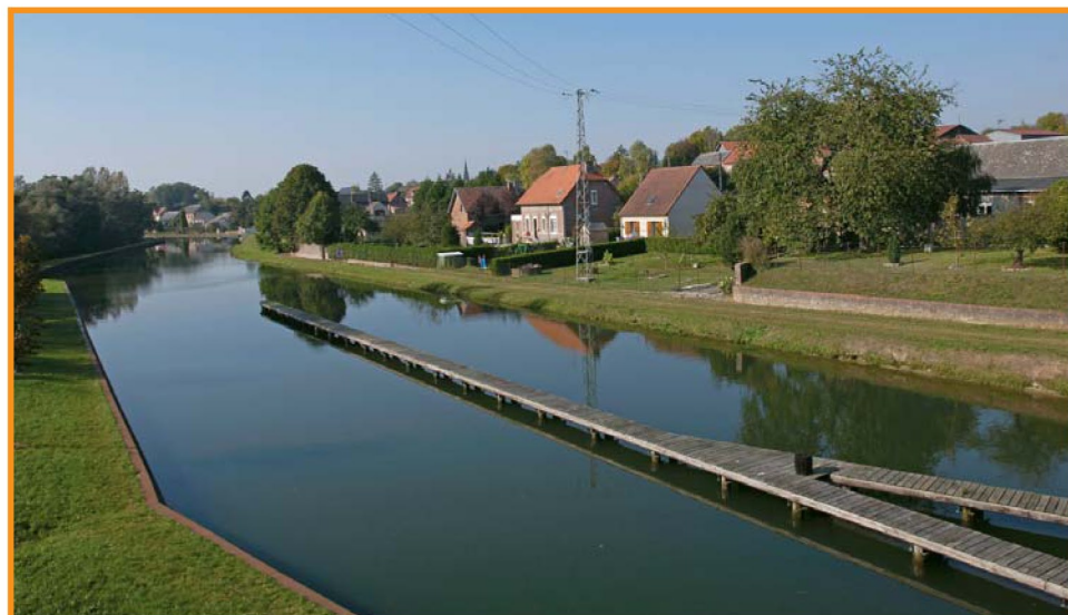
Canal de Saint-Quentin à Fontaine-lès-Clercs.

Situé sur le bras mort du canal, l'ancien port de Seraucourt a été reconverti en halte nautique. Sous le signe de l'eau et de la botanique, ce circuit traverse la zone floristique et ornithologique des marais de la Somme, entre peupleraie, aulnaie et saulaie.